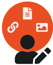
Creëer jouw content